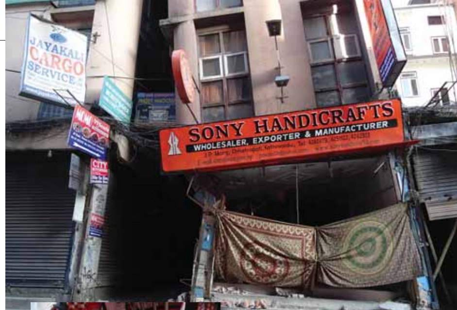
Budova v Thamele (Káthmandu) poškodená zemetrasením.