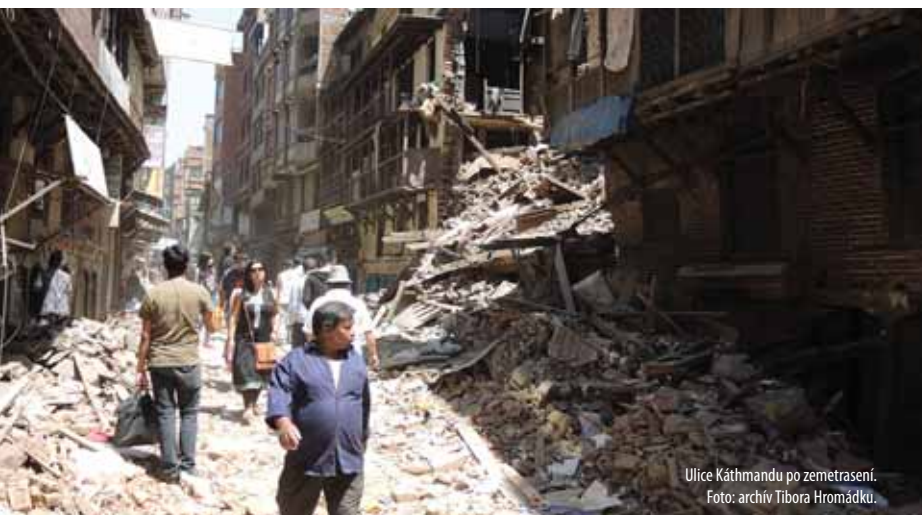
Ulice Káthmandu po zemetrasení.

V prvom rade som si uvedomoval, že sme mali obrovské šťastie a ďakoval som himalájskym bohom za túto zhovievavosť. Expedícia sa síce vracala bez vrcholu, ale boli sme v plnom počte, zdraví a so všetkými prstami. Preto považujem túto expedíciu za úspešnú, lebo predstava, že by sme sa domov vrátili bez niektorého z kamarátov,