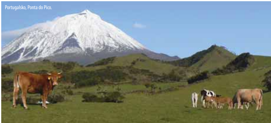
Portugalsko, Ponta do Pico.

Do Litvy som sa po prvý krát dostal v roku 2000. Jej najvyšší bod menom Juozapinė má nadmorskú výšku iba 292 m. Leží blízko hraníc s Bielorus-