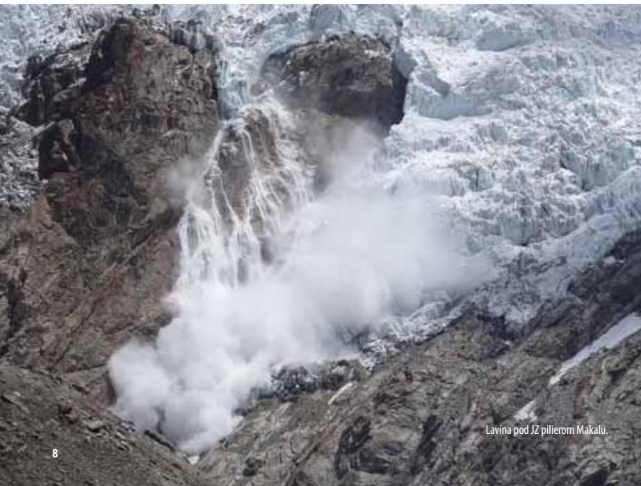
Lavina pod JZ piliérom Makalu.

Veľa toho nebolo. Do ABC sme prišli 21. 4. večer. Dva dni sme doladzovali veci v tábore, stavali stany, triedili materiál a chystali vynášky. 24. 4. sme