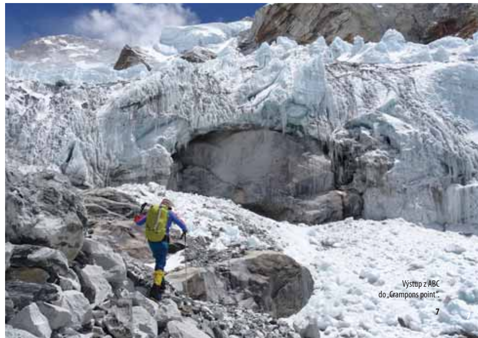
Výstup z ABC do „Crampons point“.

ABC bolo vo výške asi 5700 m. Mali sme tam stráviť mesiac, keďže BC je len prestupná stanica. V takej výške sa telo ťažko a pomaly regeneru - ▶