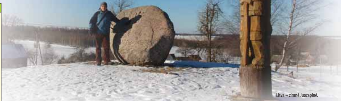
Litva – zimné Juozapinė.