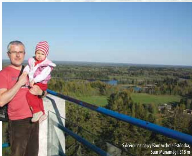
S dcérou na najvyššom vrchole Estónska, Suur Munamägi, 318 m

Znie to síce jednoducho, ale jednoduché to vôbec nie je. Otázka číslo jedna znie, čo je vlastne Európa a kde sú jej hranice. Ako vieme, Európa totiž tvorí jeden celok s ďalším kontinentom a tým je Ázia. Ich hranice sú teda dané skôr kultúrne ako vyslovene fyzicko-geograficky. Aj v tomto delení nepanuje jednota. Zhoda je, že hranica vedie východným úpäťm pohoria Ural a potom riekou Emba po jej ústie do Kaspického mora. Americkí geografi potom hranicu vedú po hlavnom hrebeni Kaukazu, európski severne od tohto pohoria cez tzv. Kumomanyčskú znížninu po ústie Donu do Azovského mora. Hranica cez Bospor, Marmarské more a Dardanely je zase jasná. V Stredozemnom mori patria k Európe všetky veľké ostrovy okrem Cypru (a tých blízko afrického pobrežia), v Atlantiku sú súčasťou Európy Madeira, Azorské ostrovy, Faerské ostrovy či Island. Rovnako k nej patria aj Špicbergy či Zem Františka Jozefa. Ja som sa teda pri výbere priklonil ku geografom z Európy. ▶