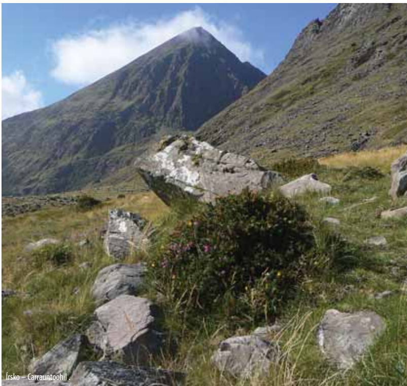
Írsko – Carrrauntoohil

cegoviny (obývajú ju Moslimovia a Chorváti) a Republiky Srbskej. Najvyšší vrchol krajiny leží v jej srbskej časti na hraniciach s Čiernou Horou. Autom sa treba dopraviť do dediny Tjentište, odkiaľ vedie do hôr úzka asfaltka, ktorá turistu privedie cez Dragoš sedlo až na sedlo Prijedor, ktoré je dobrým východiskom výstupu na Maglič. Na kopec sme sa vybrali v máji 2008, počasie bolo krásne, na horách však ležalo ešte veľké množstvo snehu. Spadnutý strom krížom cez lesnú cestu nás prinútil nechať autá ešte pred sedlom Prijedor. Výstup naň bol po ceste pohodlný a výhľady čoraz krajšie. Zo sedla sme museli zostúpiť do údolia s množstvom lavínou strhnutých stromov