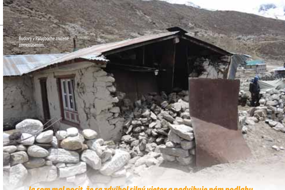
Budovy v Pangboche zničené zemetrasením.

Ja som mal pocit, že sa zdvihol silný vietor a nadvihuje nám podlahu stanu. Až po pár sekundách nám došlo, že sa to vlní zem. Pochopili sme, že je zemetrasenie. Zem sa hýbala do strán a vlnila sa v rádiuse takých 20 cm.