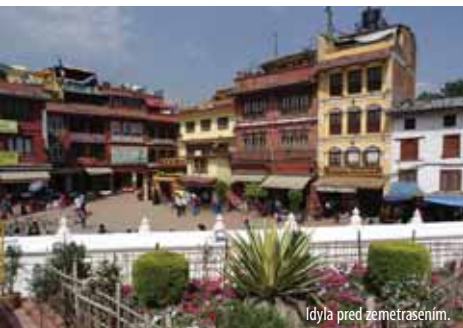
Idyla pred zemetrasenim.

rali sme situáciu a ďalší postup. Vtedy bolo niekoľko členov iných expedícií ešte nezvestných, pretože v čase zemetrasenia boli hore nad ABC a nebolo jasné, či sú v poriadku. Neskôr sme do-