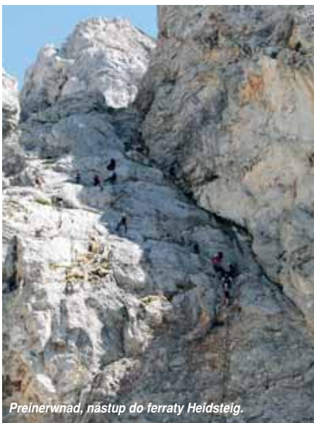
Preinerwand, nástup do ferraty Heidsteig.

Z Bratislavy na dostrel vzdialená skupina Rax-Schneeberg v Rakúsku okrem skialpinistických túr a hodnotných skalkárskych lokalít ponúka tiež niekoľko ferrát. Vápencová stena Preinerwand nad dedinou Prein an der Rax s ferratou klasifikácie C-D môže byť aj cieľom na jednoduchový výjazd. Za dlhým názvom Hans-von-Haid-Steig nájdete jednu z najznámejších a najodvážnejších zaistených ciest nielen tejto lokality, ale i v rámci celého Rakúska. Haidsteig prekonáva exponovanou líniou pravú časť steny Preinerwandu (1783 m) a patrí vraj k naj-