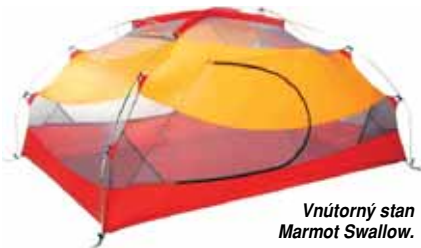
Vnútorný stan Marmot Swallow.

Pri výbere stanu je dôležitý aj materiál, z ktorého je vyrobený. Tropiko (vrchná vrstva natiiahnutá nad celým vnútorným stanom aj s konštrukciou) je zväčša s PES tkaniny s PU záterom. Jeho kvalitu sčasti naznačuje parameter nepriepustnosti vody (čím vyšší, tým by mal byť kvalitnejší), no ten nie je smerodajný, pretože rozhoduje ešte aj váha. V zásade sa však so stanom nejdete potápať, takže pri dobrej konštrukcii voda stečie a žiaden „vodný stĺpec“ na povrchu nevzniká. Je ale nutné, aby bol odolný voči ultrafialovému žiareniu, hlavne pri stanoch do väčších nadmorských výšok. Kvalitné stany