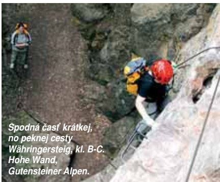
Spodná časť krátkej, no peknej cesty Währingersteig, kl. B-C. Hohe Wand, Gutensteiner Alpen.

Ideálnym miestom aj na jednodňové výjazdy je Hohe Wand (Gutensteiner Alpen) – niekoľko kilometrov dlhý a miestami vyše 100 metrov vysoký skalný múr. Vápenc výbornej kvality predurčuje túto lokalitu na lezenie, čo v hojnej miere využívajú lezci z Viedne a okolia, ale stále populárnejšia je už aj na západnom Slovensku. Okrem množstva lezeckých ciest sa vyplatí vyskú-