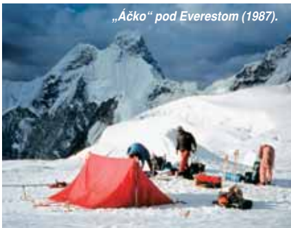
„Áčko“ pod Everestom (1987).

Moderné kupolové stany sú dnes najpoužívanejšie. S výnimkou extrémnych horolezeckých stanov sú dvojvrstvé. Ich konštrukcia je veľmi stabilná aj vo vetre, jednoducho sa stavajú a s výnimkou stanov s veľkou apsidou sú samonosné, čiže núdzovo sa nemusia kotviť a aj postavené sa dajú jednoducho premiestniť. Avšak ich doko-