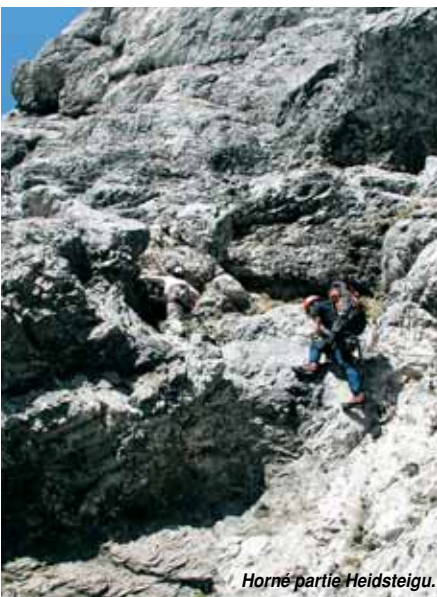
Horné partie Heidsteigu.

Počítajte s tým, že idete na celodennú túru a prameň je asi trištvrte hodiny od nástupu. Od konca ferraty k najbližšej chate s pivom je to asi 10 minút po turistickom chodníku (Neue Seehütte). Na ambiciózných športovcov čaká samozrejme vrchol hory, ktorý je od poslednej kotvy tiež asi 10 minút.