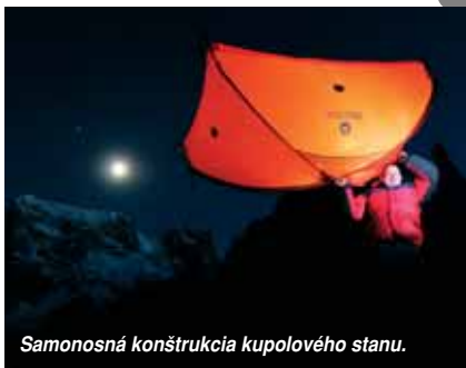
Samonosná konštrukcia kupolového stanu.

Moderné kupolové stany sú dnes najpoužívanejšie. S výnimkou extrémnych horolezeckých stanov sú dvojvrstvé. Ich konštrukcia je veľmi stabilná aj vo vetre, jednoducho sa stavajú a s výnimkou stanov s veľkou apsidou sú samonosné, čiže núdzovo sa nemusia kotviť a aj postavené sa dajú jednoducho premiestniť. Avšak ich doko-