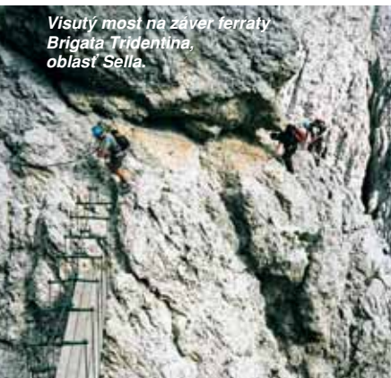
Visutý most na záver ferraty Brigata Tridentina, oblasť Sella.

Ferrata s veľkým F v tejto lokalite má názov Brigata Tridentina (Via Ferrata Pisciadú). Odvážne vedená cesta stúpa jednou z najdivokejších a najromantickejších stien na severnej strane masívu Sella. Je vyrovnaná, v niektorých pasážach dosť exponovaná, ale výborne zaistená a s dostatkom prirodzených chytov i stupov. No predovšetkým je krásna.