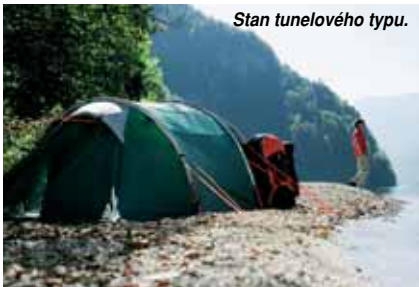
Stan tunelového typu.

Tunelové stany sú u nás veľmi málo známe. Pritom majú najlepšie využiteľný vnútorný priestor i veľmi dobrý pomer medzi pôdorysom a hmotnosťou (vďaka jednoduchej konštrukcii). Veľmi rýchlo sa stavajú. Ich nevýhodou je nutnosť kotvenia. Sú predurčené do menších nadmorských výšok, Mimoriadne obľúbené sú hlavne v Škandinávii, kde je národným zvykom kempovať aj v zime. Vtedy sa prejaví ich veľká výhoda - pozdĺžny tvar, ktorý pri správnom nasmerovaní po vetre umožní dobré vetranie a odvádzanie vodných pár (dýchanie, varenie), ktoré sú pri zimnom stanovaní najväčším nepriateľom.