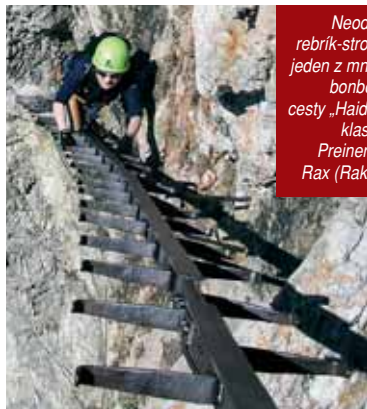
Neodistený rebrík-stromček, jeden z mnohých bonbónikov cesty „Haidsteig“, klas. C-D, Preinerwand, Rax (Rakúsko).

Veľmi ťažké (D): Strmý, často previsnutý terén. Železné svorky a skoby ležia ďaleko od seba. Veľmi zvislá až previsnutá